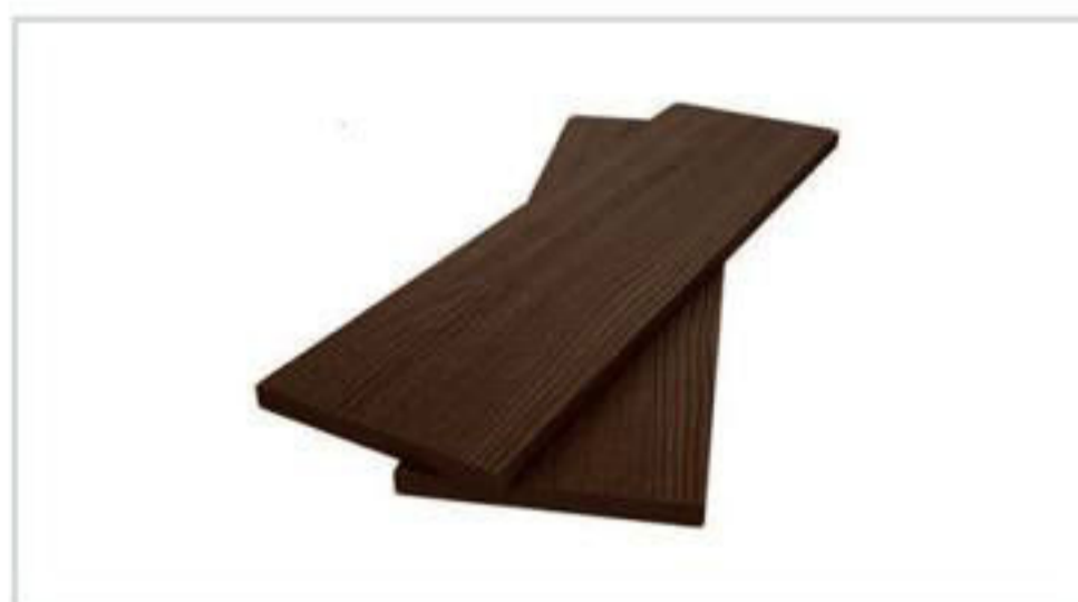
Подступенок/доска заборная 140x12