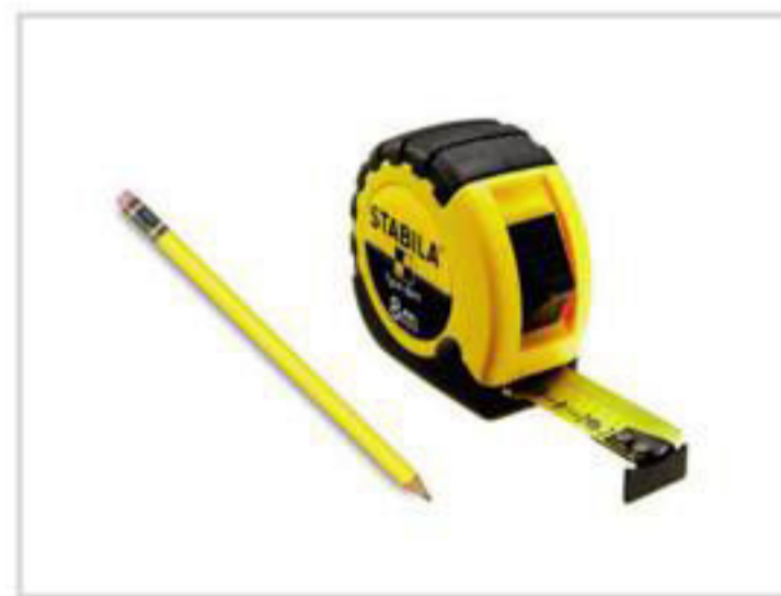
Рулетка и карандаш